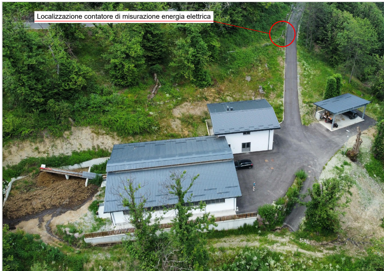
Vista 4 - Posizione contatore società elettrica