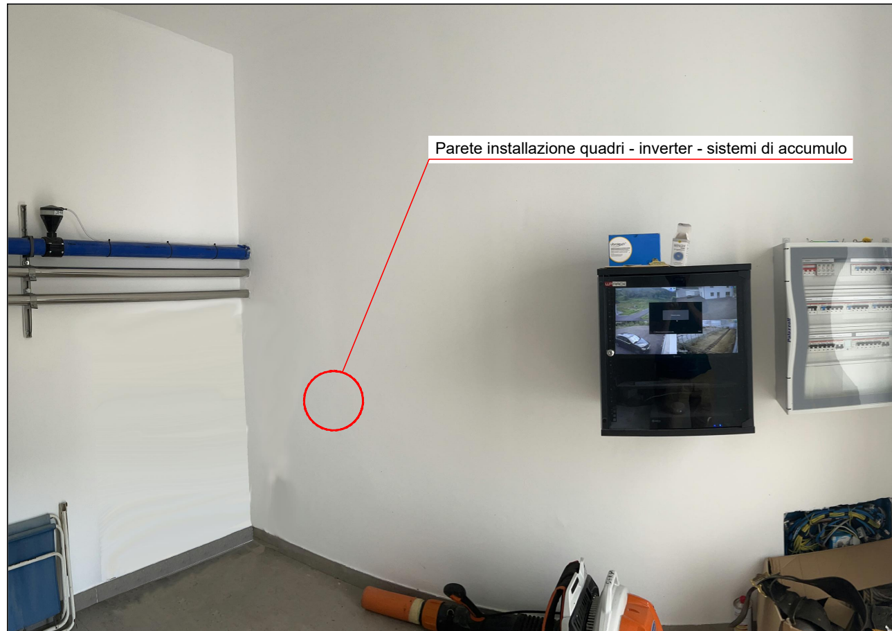
Vista 3 - Posizione armadio quadri e inverter